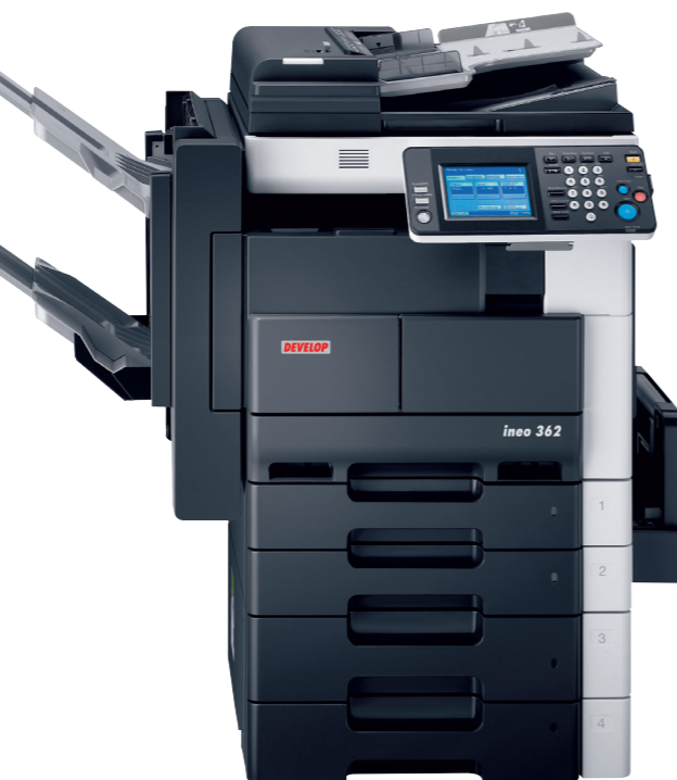
iNeo 362 с встроенным финишером (FS-530), активной тумбой (PC-206) и автоподатчиком (DF-620)

Офисы с большим документооборотом часто отдают часть печатных работ в специализированные печатные компании, особенно если требуются какие-либо финишные работы. iNeo 222 / 282 / 362 позволяют выполнять все эти работы в офисе, благодаря разнообразным финишным устройствам, таким как изготовление брошюр, угловое степлирование, перфорация и сортировка. Многие компании, например, как правило, распечатывают несколько экземпляров контрактов. iNeo 222 / 282 / 362 будут печатать, сортировать, степлировать и перфорируют каждую копию контракта, таким образом, останется только поставить подпись. Это удобное и времясберегающее решение!