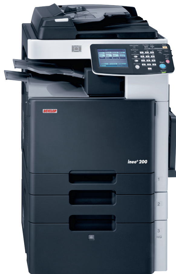
iNeo+ 200 с автоподатчиком (DF-612), отделительным лотком (JS-505), лотком ручной подачи (MB-502), универсальной кассетой (PC-105) и активной тумбой большой ёмкости (PC-405)

Переходите на цветную офисную технику? Только без паники! Develop iNeo+ 200 специально разработан, чтобы сделать этот переход более простым и экономичным одновременно. Забудьте про все истории о том, как сложно и дорого распечатывать цветные документы. Мультифункциональный аппарат iNeo+ 200 совсем недорог в эксплуатации и прост в использовании, то есть это идеальное решение для распечатывания презентаций, счетов или писем на бланке Вашей компании, а также любых других документов Вашего офиса.